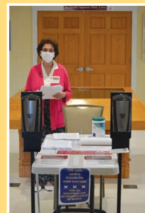
마스크와 손 소독제