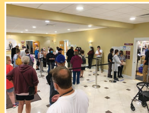
성물 센터에서 줄을 설 때, 축복의 지점에서 기도할 때 사회적 거리두기 실천