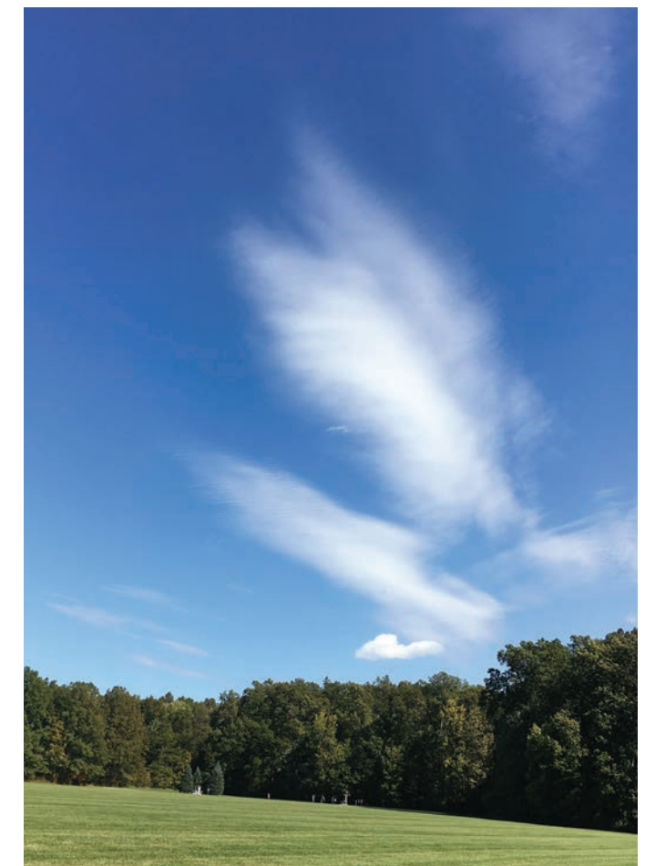
하나되신 성심의 별판 위에 나타난 천사 날개 모습의 구름