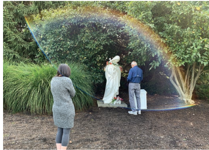
2020년 9월 15일 ‘세 가지 축복’이 주어진 직후 고통의 성모 마리아 성지에서 찍힌 기적적인 사진

■ 2020년 9월 13일. “나는 다가오는 마리아의 고통의 축일에 있을 ‘기도의 날’에 이 성지로 순례를 오도록 사람들의 마음을 준비시키고 있다. 마리아는 나의 외아들의 어머니로 선택된 총애를 입었지만 일생동안 용감하게 수많은 고통을 겪어왔다. 나는 지상에서 마리아를 도와주도록 요셉을 그녀에게 주었다. 또한 마리아는 일생 동안 나와 친밀한 관계에 의지하였는데, 안나 성녀가 그렇게 하도록 그녀를 가르쳤다... 그러므로, 나는 거룩한 성모의 고통을 기념하는 날에 이 성지에 올 모든 이들을 볼 생각에 매우 기쁘다. 나는 그날 이곳에 오는 모든 이들에게 다시 한 번 나의 ‘세 가지 축복’을 베풀어 그들을 존중해 줄 것이다. 이곳에 오기로 선택하여라.”