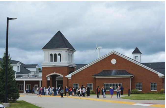
아퀴나스 센터와 성물 센터로 들어가기 위해 줄 서 있는 사람들

■ 2020년 7월 19일. “이제 나의 ‘세 가지 축복’은 내가 축복한 기도 카드의 형태로 세상에 베풀어졌다. 여행에 관한 모든 제한 조치를 고려해볼 때 이것이 나의 ‘세 가지 축복’을 전 세계에 퍼