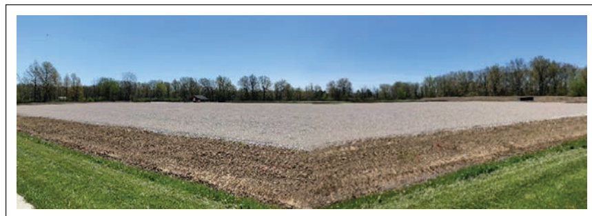
2020년 5월 '하나되신 성심의 별판' 건너편에 새로 오픈한 525개의 주차 공간을 지닌 새 주차장

■ 2020년 7월 7일. “자녀들아, 이것이 너희가 나의 '세 가지 축복'을 받을 수 있는 방법이다. 기도를 하면서 ('세 가지 축복'을 청하여라). 마음속에 믿음을 지닐 수 있도록 기도하여라. 믿음은 너희가 나의 가장 강력한 축복을 받을 때 경험할 수 있는 심오한 체험의 토대다. 너희가 이 성지를 방문할 때 예기치 못하게 이 축복이 너희 위에 내려게 되면, 너희의 마음이 이미 확고한 믿음으로 준비되어 있게 하여라. 나는 세상에서 이 축복을 믿는 이들에게 이 축복을 베푼다. 이것은 교회 출석은 말리면서 낙태는 찬양하는 지금 이 시대를 위한 은총이다. 너희는 믿음으로써 아무것도 잃을 것