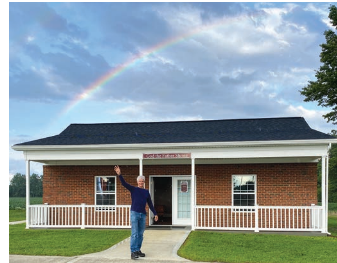
새로운 하느님 아버지 경당 위에 나타난 무지개

은 각각의 카드에 붙어 있는 천조각에 깃들여 있다. 지상의 영혼들에게 다가가기 위해 내가 이렇게까지 한 적이 일찍이 없었다. 그러나 이렇게까지 수많은 이들에게 영향을 주어야 하는 필요성이 요구되었던 때도 일찍이 없었다. 인간의 오만과 죄에 대한 애착의 결과로서 앞으로 어떤 일들이 일어나게 될 것이다. 나의 ‘세 가지 축복’을 받아들이는 이들은 강화될 것이며 앞으로 다가올 일들을 좀 더 잘 견뎌낼 수 있도록 준비되어 있을 것이다.”