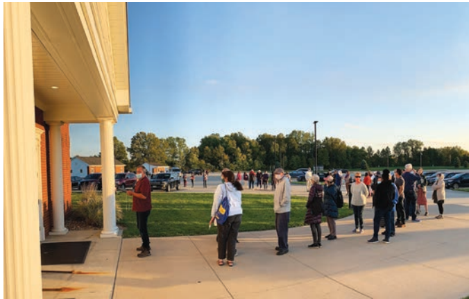
저녁 7시 목주기도 모임을 위해 하나되신 성심의 기도회관에 들어가기 위해 줄 서 있는 사람들

것이지만, 지금 이 시대(에 일어나는 일들을) 주시하고 이 시대에 순응해야만 한다. 곧, 버스로 (순례를) 오거나 큰 무리를 지어 붙어 다니면서 여행하지 마라. 너희가 성지를 오고 갈 때, 또 너희가 이 성지를 방문하고 있는 동안에도 사회적 거리두기를 실천하면서 현 시대가 요구하는 바를 따라야만 한다. 이 시대의 위험을 인식하고, 마스크를 착용하여라. 축복 카드를 얻기 위해 노력하는 데 있어 공손한 태도를 지녀라. 이 카드로부터 수많은 은총이 베풀어지고 있지만, 너희가 다른 이들의 권리를 존중하면 심지어 그보다도 더 많은 은총이 베풀어지게 된다. 이 축복 카드를 얻는다는 것은 너희가 나의 제자가 된다는 뜻이며, 또한 이 카드와 (거룩하고 신성한 사랑의) 메시지들을 전파하기 위해 노력할 것을 너희에게 요구한다는 사실을 명심하여라. 시간이 지남에 따라 더 많은 축복 카드가 만들어질 것이다. ‘세 가지 축복’ 카드를 얻으러 이곳에 오기 위해 노력하면서 그날 나를 기쁘게 하기 위해 한마음 한뜻이 되어라.”