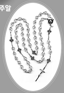
5단 태아 목주