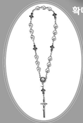
짧은 태아 목주