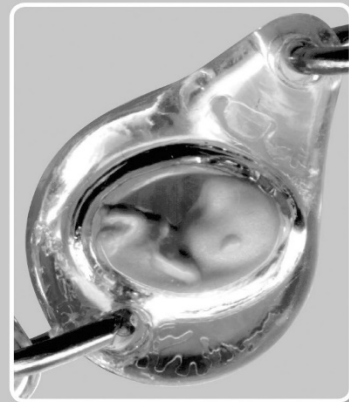
magnified view of bead