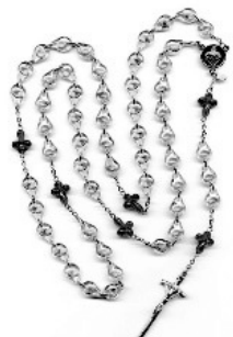
5단 태아 목주