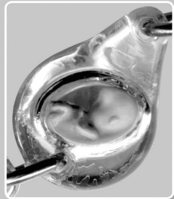
magnified view of bead