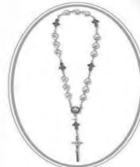
Chaplet of The Unborn