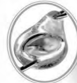
magnified view of bead